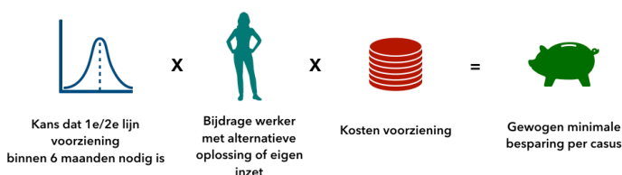
Aantal hulpvragen en besparing per werksort

Hierbij is rekening gehouden met de kans dat er binnen 6 maanden hulp zou zijn ingezet, en het effect van de medewerker op het voorkomen van geïndiceerde zorg of overige ondersteuning.